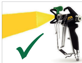
Идеальный факел распыления без полос