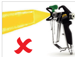
При появлении полос, плавно увеличивайте давление